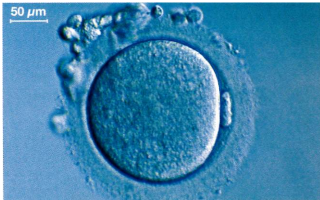
Ovule humain observé au microscope optique (SVT 4 e . Didier 2007)